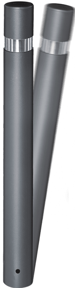
Hospitalet Durable Amovible H214FM