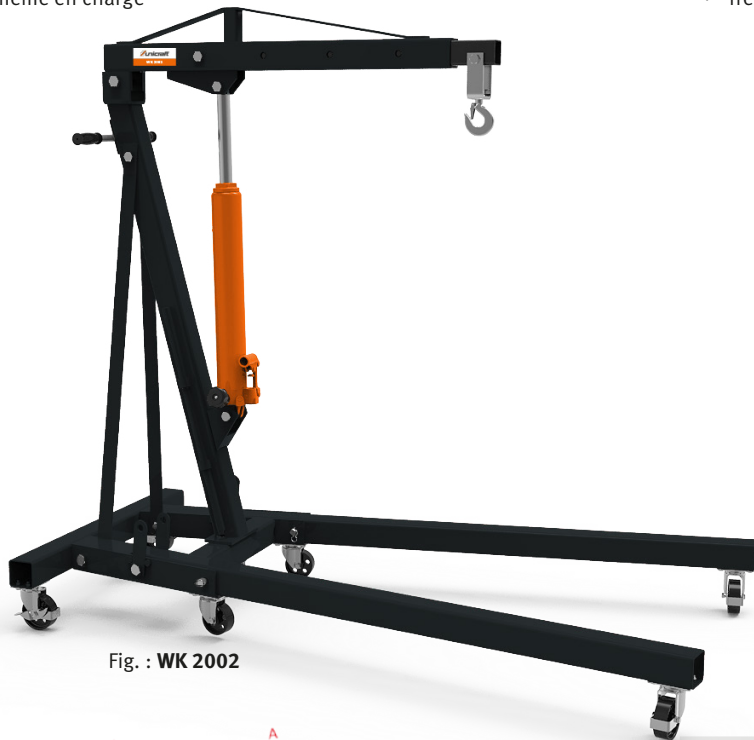
Fig. : WK 2002