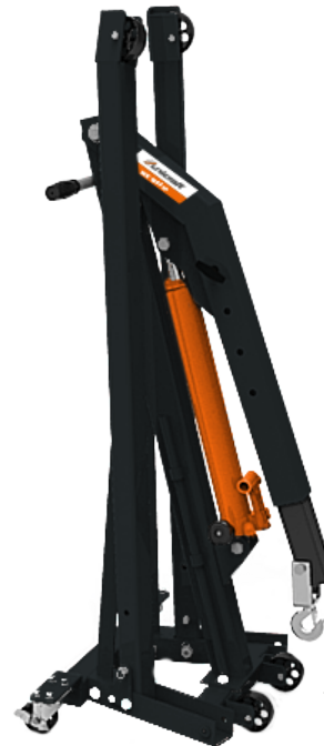
· Les 2 modèles se replient