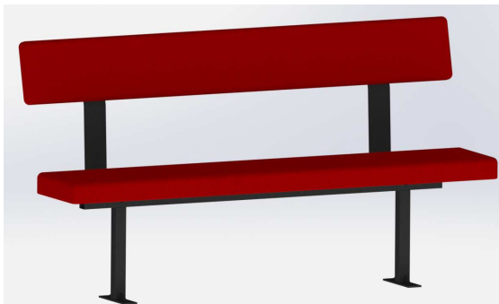
Banquette filante fixe pour tribune télescopique. Fixations au sol invisibles.

Les banquettes filantes sont posées en nez de gradin. Elles sont fixées directement sur le platelage de la tribune. Elles sont fixées par-dessous, rendant ainsi les fixations invisibles.