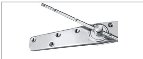
Bras de lavage et de rinçage en inox Stainless steel washing and rinsing arms