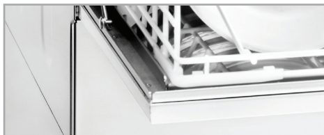
Porte double paroi Double skinned door