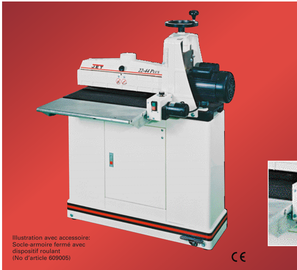
Illustration avec accessoire: Socle-armoire fermé avec dispositif roulant (No d'article 609005)