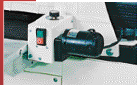
Nouveau exclusivement avec Sand Smart