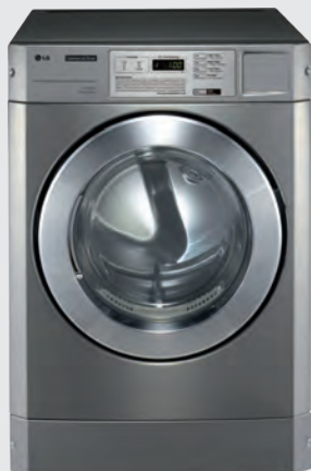
RV1329CD4P (élec) / RN1329A4S (gaz) modèle standard