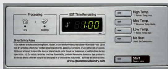
Tableau de commande multilingues.

Arrêt automatique avec refroidissement en fin de cycle.