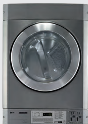
RV1329CN7P (élec) / RN1329AN7S (gaz) tableau de bord en bas, emplacement pour monnayeur double, avec kit de superposition