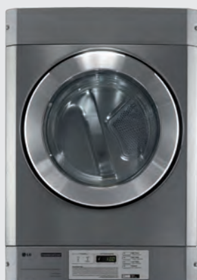
RV1329CD7P (élec) / RN1329A7S (gaz) tableau de bord en bas, avec kit de superposition