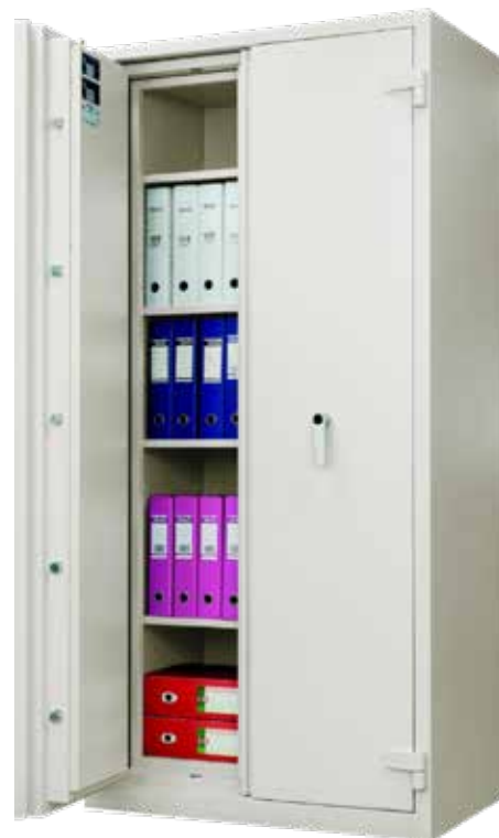
FI 500 S4