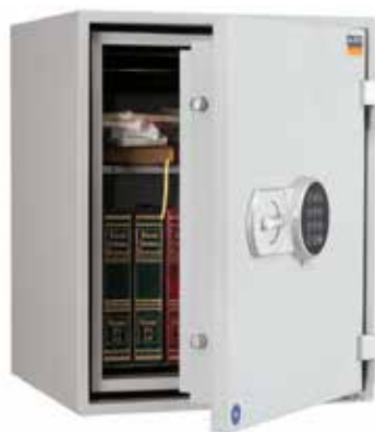
FU 50 S4