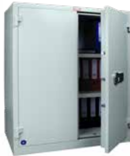
BSP 150 S4