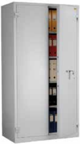
BS 200 S1