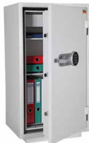
FU 110 S4