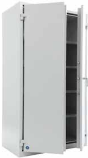
BSP 200 S1