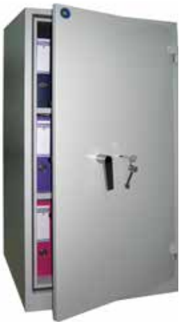
BS 100 S1

» Alternative parfaite de l'armoire ignifuge 30 minutes, son design s'intègre parfaitement dans l'environnement de vos espaces de travail.