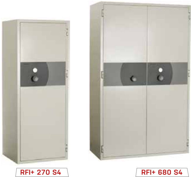
RFI+ 270 S4