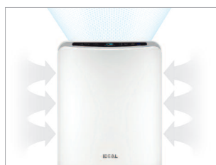
Redistribue l'air purifié de façon optimale dans toute la pièce.