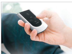
Télécommande pratique (portée de 6 mètres).