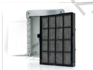
Remplacement facile et rapide de la cartouche de filtres combinés.