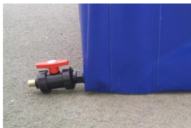
vanne de vidange( option ) - montage de 3 côtés avec bandes de roulement ( option ) + fermeture