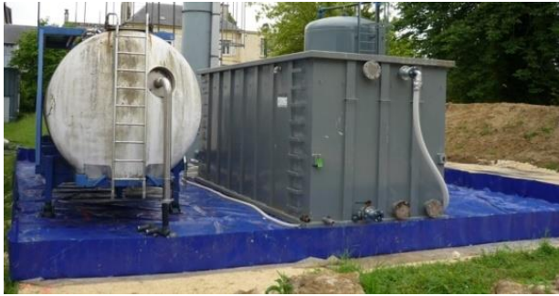
bac pour matériel dépollution sur chantier