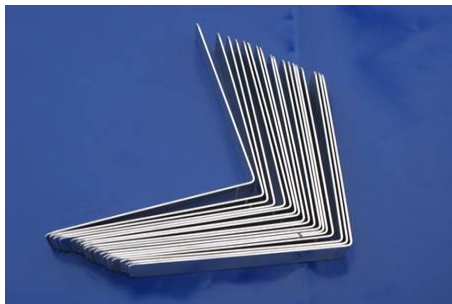
équerres en aluminium de 3 mm - insertion équerre dans fourreau --

PRECAUTIONS a prendre : le sol doit etre stable ( béton ou bitume ) et propre. Nettoyer si nécessaire pour éviter la présence de gravillons ou autres objets pouvant perforer le bac , dans le cas d'un sol déformé ou en très mauvais état : rajouter des plaques de mousses , polystyrène ou caoutchouc afin d'éviter le poinçonnement intérieur et extérieur.