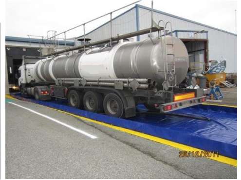
bac de rétention souple 24 000 litres

Nous vous proposons une large gamme standard de bacs de rétention souples pliables de 100 à 80000 litres avec possibilité de fabrication rapide sur mesure .