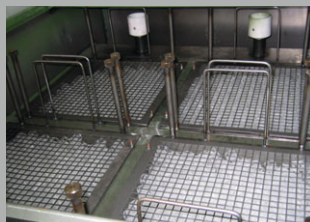
Vue détaillée : panier de filtration

Le système LFOS capte les molécules d'huile à travers un média coalescent. Les anneaux de coalescence se trouvent dans le panier de filtration et présentent une durabilité quasi illimitée. Ces anneaux peuvent être lavés en cas d'encrassement prononcé.