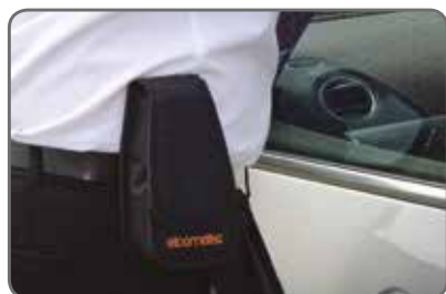
Boîtier résistant aux chocs directement clipsable à la ceinture

Commutation automatique en cas de mesure de revêtements sur acier & aluminium 2