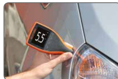
Ecran avec rotation automatique à 360° pour des mesures sous tous les angles