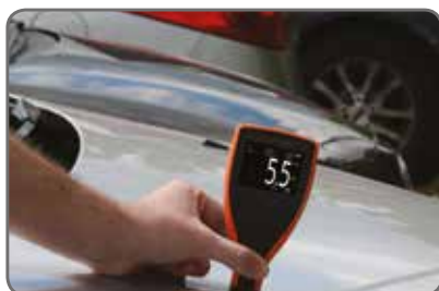
Mesure sur panneaux Acier & Aluminium 2