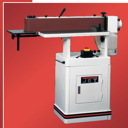
EHVS-80 sans oscillation