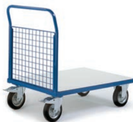
Chariot à dossier grillagé