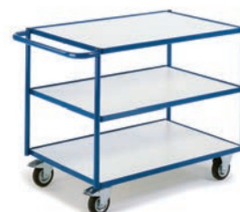
Chariot à 3 plateaux