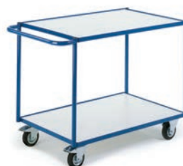
Chariot à 2 plateaux