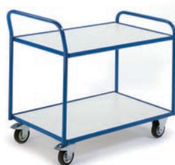
Chariot à 2 plateaux