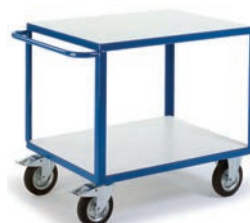
Chariot 2 plateaux