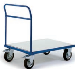
Chariot à dossier