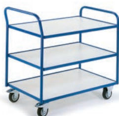
Chariot à 3 plateaux