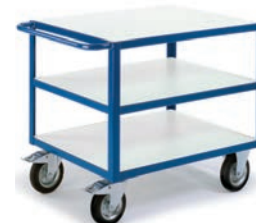
Chariot 3 plateaux