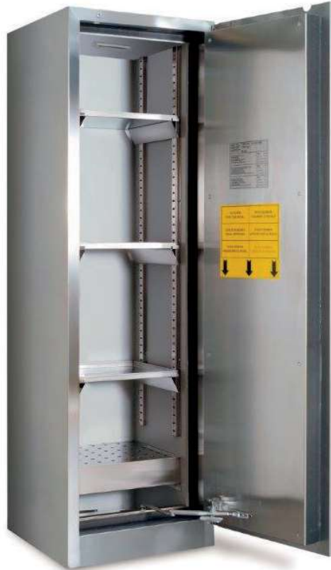
K89074 - Ouverte

RESISTANCE AU FEU CERTIFIEE 90 minutes (TYPE 90)