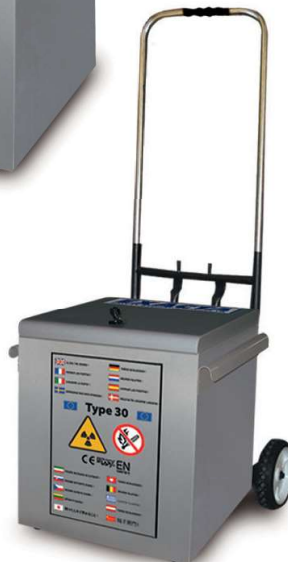
K89076 + K89132