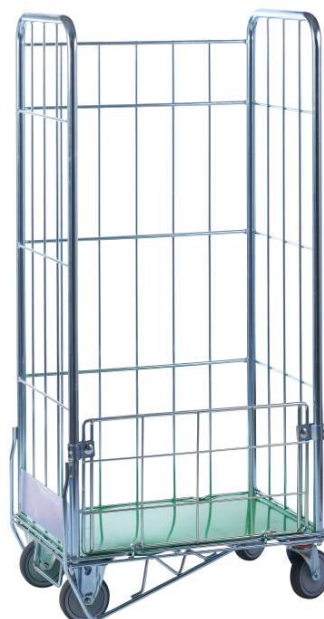
Panneau 1/3 fixe