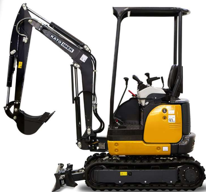
TABLEAU DES CAPACITES NOMINALES DE MANUTENTION D'OBJET - 17 VXE