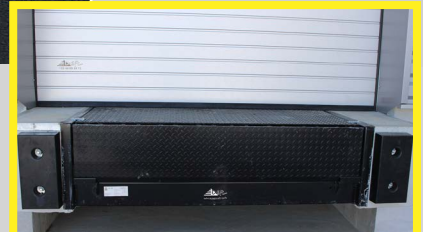
Niveleur de quai