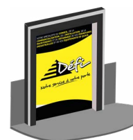
Toile standard opaque avec motif