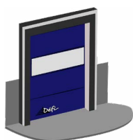
Une ou plusieurs bandes de visibilité