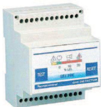
SE 139 K