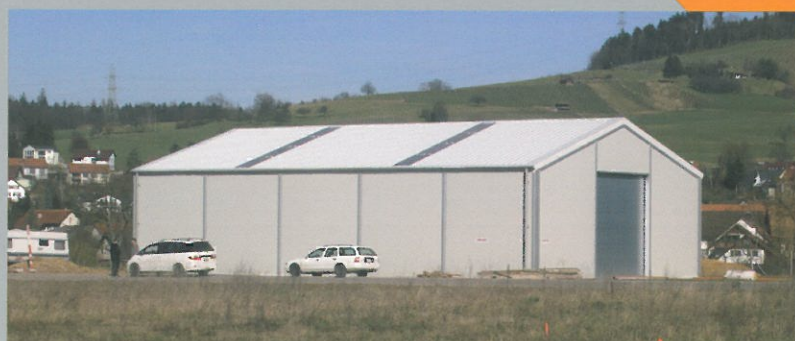
Possibilité de toiture en bac acier