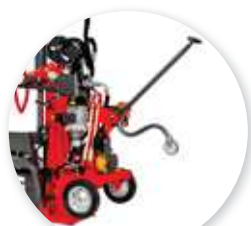
Modèle électrique avec roues