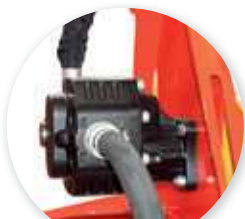
Pompe fonte : -Plus rapide -Pas d'entretien -Moins de bruit -Durée de vie rallongée