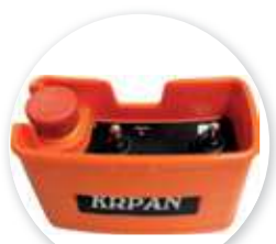
Radiocommande treuil hydraulique