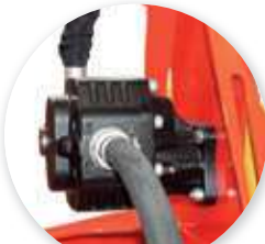
Pompe fonte : -Plus rapide -Pas d'entretien -Moins de bruit -Durée de vie rallongée