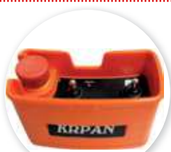
Nouvelle radio treuil hydraulique