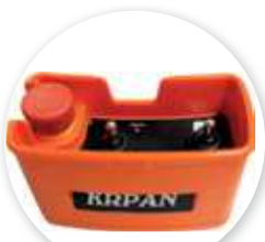
Radiocommande treuil hydraulique