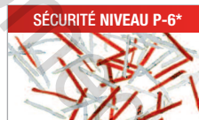
Modèle C/M - 0,8x12 mm Pour les documents ultra-secrets.