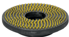
26-160-01570900 Plateau Picots Ø230