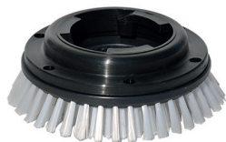
26-160-01570000 Brosse Nylon Ø230 - 0,5mm