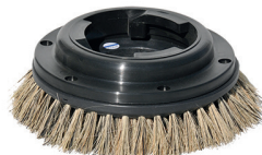
26-160-01570200 Brosse Créole Ø230