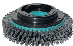
26-160-01570700 Brosse Tynex Ø260 - 1,1mm