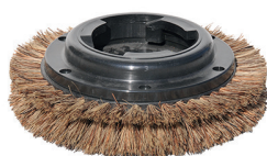
26-160-01570800 Brosse Créole Ø260