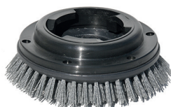
26-160-01570100 Brosse Tynex Ø230 - 1,1mm