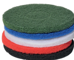
26-170-01571000 Pads - Ø254