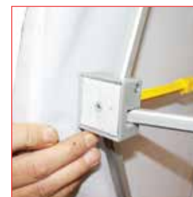
Fixation du visuel par velcro