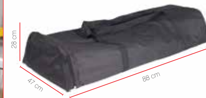
Sac de transport inclus