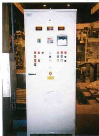
▼ ARMOIRE DE CONTROLE