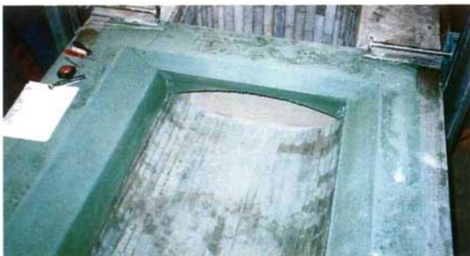
▼ Bassin et auget de puisage