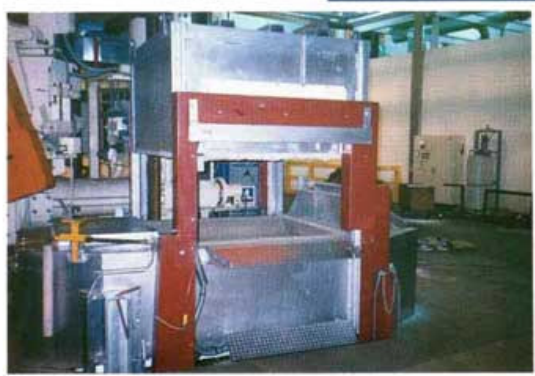
▲ VOUTE AMOVIBLE ▼