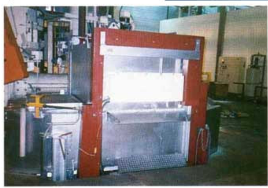
▲ Position - fonctionnement