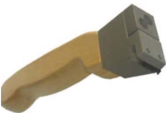
Tête plate, 1 bords tranchants

La norme EN ISO 2409 impose des peignes à 6 dents et les normes ASTM D 3002 et D 3359 11 dents.