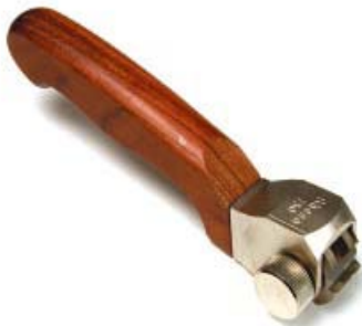
Tête ronde, 8 bords tranchants

Le revêtement se détache le long des incisions et entre les cadres par morceaux, par larges bandes. Les parties dénudées représentent de 15 à 35%.