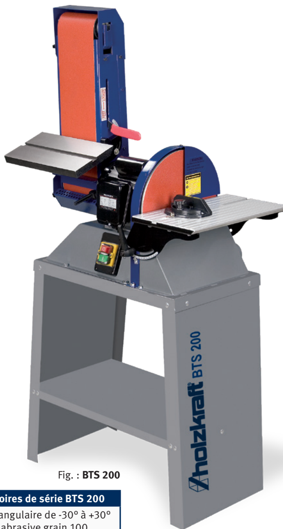
Fig. : BTS 200