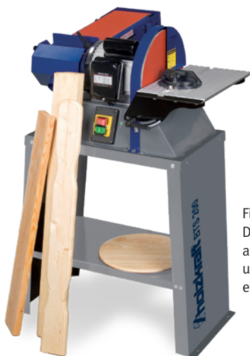
Fig.: BTS 200 De série avec butée angulaire, une bande grain 100 et un disque grain 80