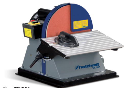
Fig.: TS 301 De série avec butée angulaire et disque grain 80