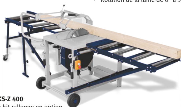
Fig.: TKS-Z 400