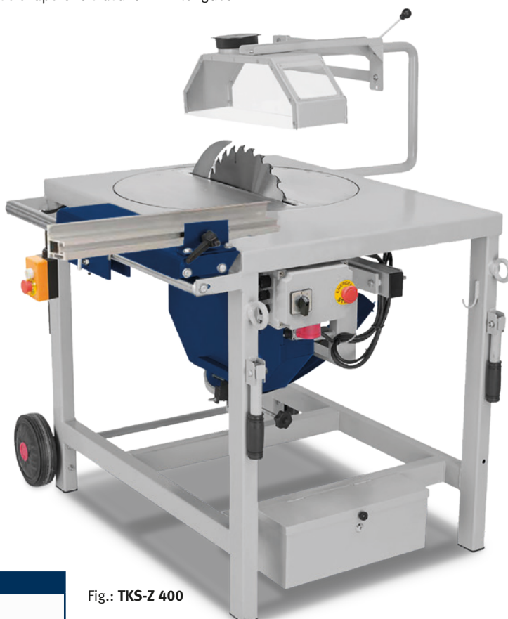
Fig.: TKS-Z 400