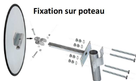
Fixation sur poteau