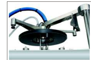
2 Entrée de liquide avec flotteur et rampe de lavage