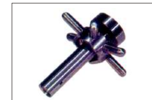
1 Etoile de commande de bec

En fin de stérilisation, la mise en route de la machine remet automatiquement les becs en position de travail.