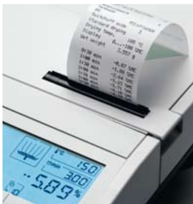
Affichage clair et protocoles compatibles aux normes GLP/GMP

La mesure de l'humidité s'effectue en trois étapes seulement : vous tarez le porte-échantillon, posez l'échantillon et appuyez sur Start. La mesure s'effectue automatiquement et vous fournit des résultats fiables en quelques minutes seulement.