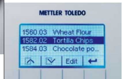
Bibliothèque de méthodes intégrée