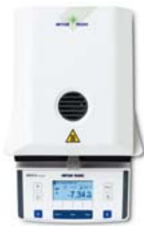
HB43-S – l'instrument tout-terrain idéal pour les mesures dans un environnement de production difficile