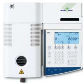
HR83 – la solution haut de gamme pour les plus hautes exigences et les domaines contrôlés