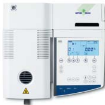
HG63 – l'instrument de précision parfait pour les tests de routine en laboratoire