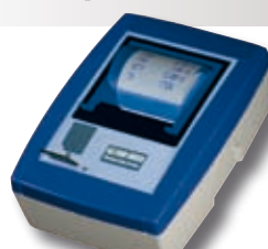
Imprimante thermique avec carte de mémoire