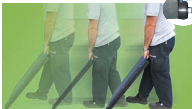
WWSD / WWSE