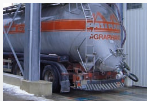
WWS montées au sol pour un pesage dynamique >>