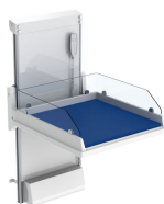
Table à langer électrique à hauteur variable 334-081-0