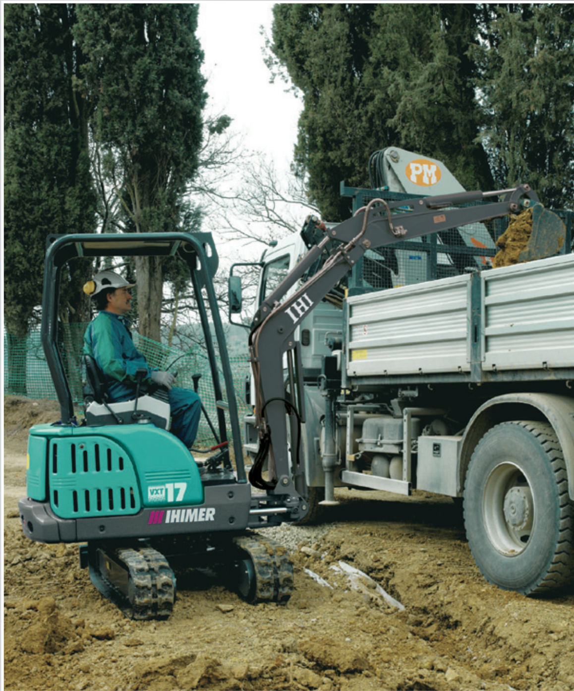
Mini-pelles 17 VXT / 19 VXT