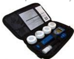
Sacoche de transport 580

Bactéries et algues sont essentiellement des hydro carbones et le chlore est un puissant agent oxydant. Le chlore détruit les bactéries et les algues en brûlant littéralement leur carbone et hydrogène en dioxyde de carbone et eau. Lorsque tous les matériaux oxydants et réducteurs ont réagi, un équilibre est atteint et il reste généralement un excédent de l'un ou de l'autre. C'est ce surplus qui crée le potentiel d'oxydation - réduction d'une solution. L'YSI ORP15 mesure ce potentiel et produit une lecture en mV.