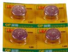
Capot & piles en recharge 606188