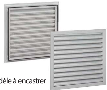
Modèle à encastrer