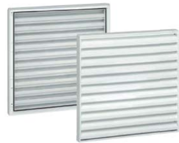
Modèle en applique