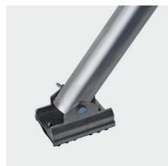
Roues diam. 200mm à blocage réglables sur 200mm et tous les 12,5mm