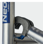
Plinthes 150 mm aluminium amovibles à mise en place rapide