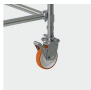
Système de liaison Ergoblock® breveté, blocage fiable d'un seul geste