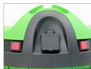
PRISE ÉLECTRIQUE EMBARQUÉE