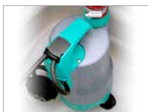
POMPE À IMMERSION PROFESSIONNELLE