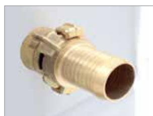
VALVE DE DÉBIT D'EAU