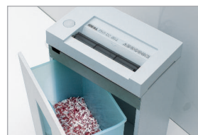
Réceptacle amovible avec fenêtre translucide

Conforme aux normes de sécurité européennes.