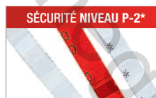
Modèle C/F - 4 mm Pour les documents internes.