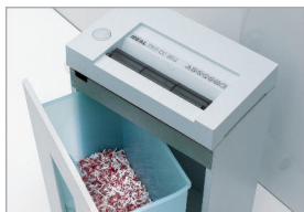
Réceptacle amovible avec fenêtre translucide