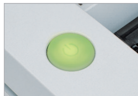
Interrupteur EASY-TOUCH avec témoin lumineux intégré