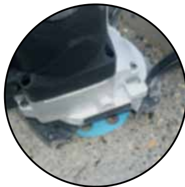
Carter démontable pour le ponçage des angles