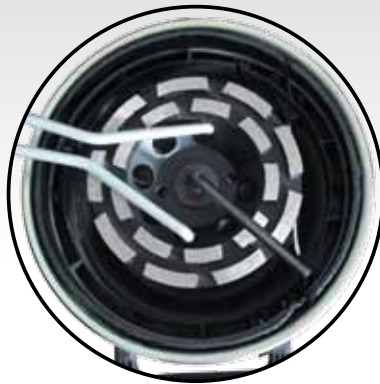
Démontage du plateau