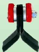
Rotor Type E/1 Couteaux universels Y