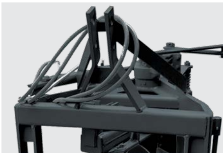
Engate hidráulico, Cat. I e II. Hitch Cat. I e II. Enganche hidráulico Cat. I y II.