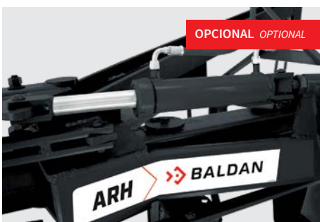
Sistema de reversão por pistão hidráulico para (ARH-L). Hydraulic swing system available for ARH(L). Sistema de reversión a través de pistón hidráulico para el modelo ARH (L).

Standard: ARH(L) com reversão manual. Opcionais: discos de 26" e 28" para ARH(L), discos de 28" e 30" para ARH(P). Sistema de reversão por pistão hidráulico ARH(L).