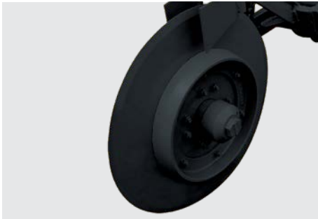
Roda guia. Guide wheel. Rueda guía.