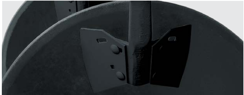
Limpadores de discos. Disc scrapers. Limpiadores de discos.