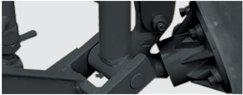
Cubo dos discos de rolamentos cônicos à graxa com lubrificação permanente. Greased conical disc hub (lubrication free). Maza de los discos con rodamientos cónicos con grasa.