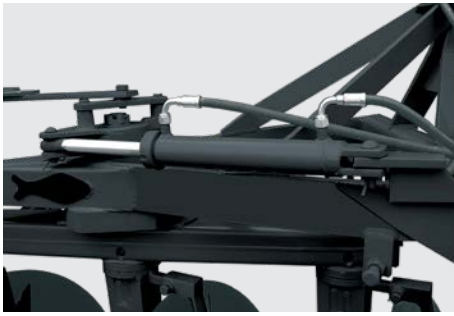
Estrutura: vigas tubulares de alta resistência. High strength frame. Estrutura: vigas tubulares de alta resistencia.