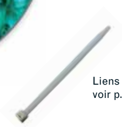
Liens plastiques voir p.27