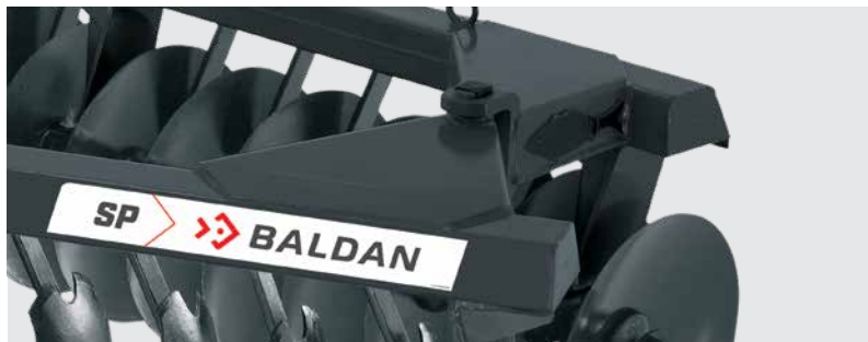
Estrutura construída por vigas tubulares de alta resistência. High strength frame. Estructura: vigas tubulares de alta resistencia.