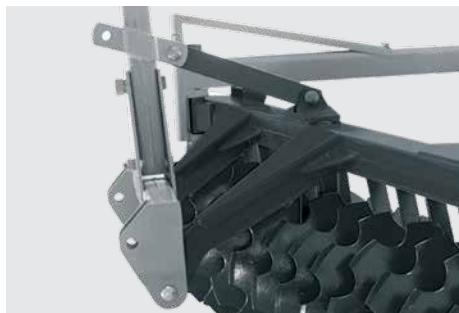
Engate: categoria de engate II. Hitch category II. Tipo de enganche: categoria II.