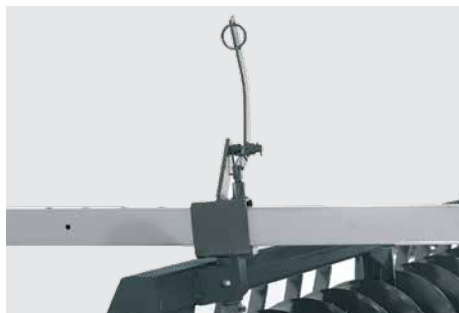
Barra de abertura e travamento. Device for opening and lock of gangs. Barra de abertura y trabamiento.