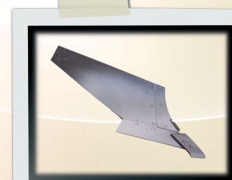
Cylindrique long plat