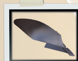
Hélicoïdal Scandinave 2