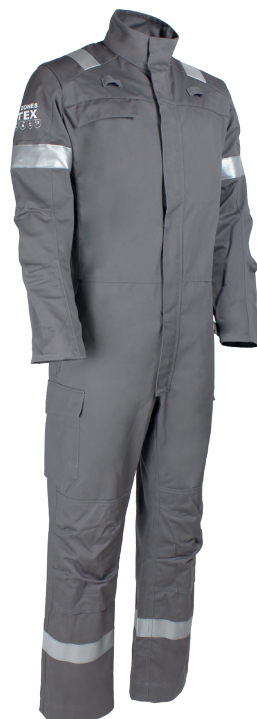
Gris Acier 20