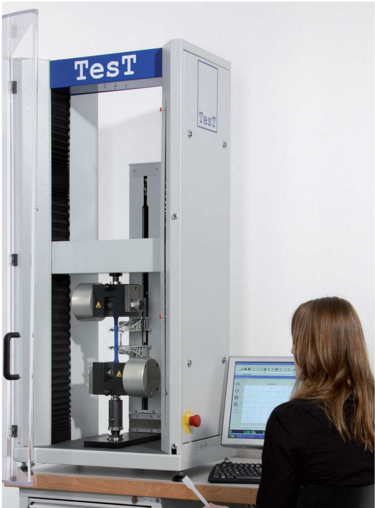
Modèle 112.50kN avec mors pneumatique et extensomètre automatique

Machine d'essai universelle modèle 112 – capacité de 5 à 100kN – modèle de table