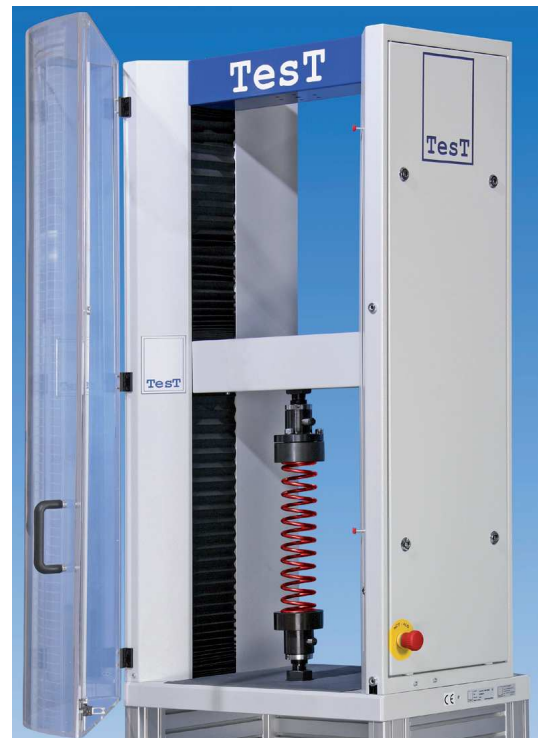
Modèle 112.20kN avec plateaux de compression