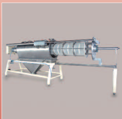
Vue d'ensemble avec maintenance de la grille de tamisage