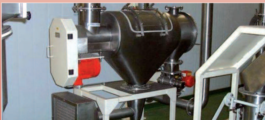
Implantation du tamis sur une ligne de transfert pneumatique