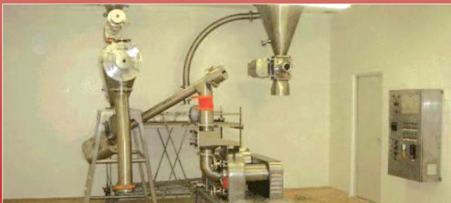
Ligne de broyage avec tamisage en amont