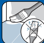
Ne peluche pas