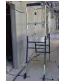
Largeur 0,68 m pour passage des portes ou travail dans les couloirs.