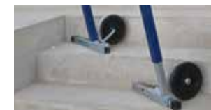
Réglage indépendant des 4 pieds.