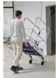
Pliée, la Gazelle se transforme en chariot.