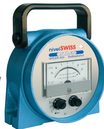
nivelSWISS réf. 50 H Pour vérification horizontale

Livré en coffret avec : 4 piles AAA 1,5V et adaptateur, mode d'emploi