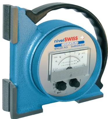
nivelSWISS réf. 50 W Equerre 90° pour vérification vertcale et horizontale

Les niveaux électroniques nivelSWISS à lecture analogique éprouvés depuis des décades, apportent une haute précision de mesure grâce à un corps massif en fonte à faces parfaitement usinées et finition grattée à la main. L'alimentation par piles rend l'instrument entièrement autonome. Ces niveaux sont très adaptés pour la mesure de faibles inclinaisons. Ils possèdent une sortie analogique pour la connexion d'un appareil enregistreur.